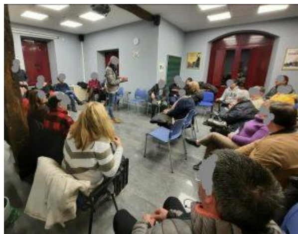
Presentación de la APP – enero 2023